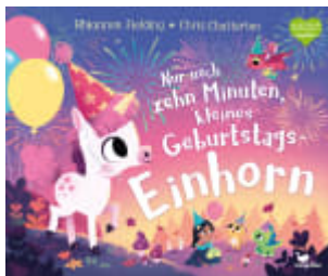
Nur noch zehn Minuten, kleines Geburtstags-Einhorn