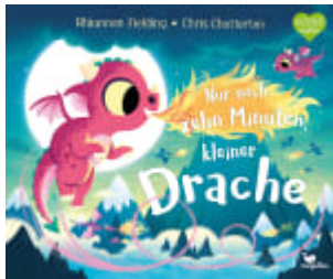
Nur noch zehn Minuten, kleiner Drache