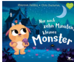
Nur noch zehn Minuten, kleines Monster