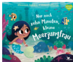
Nur noch zehn Minuten, kleine Meerjungfrau