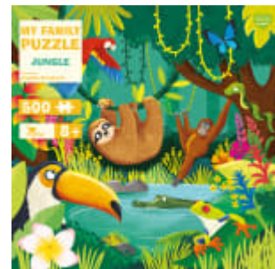
My Family Puzzle - Jungle