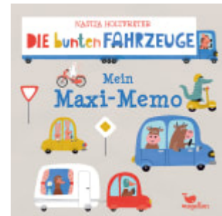
Die bunten Fahrzeuge - Mein Maxi-Memo