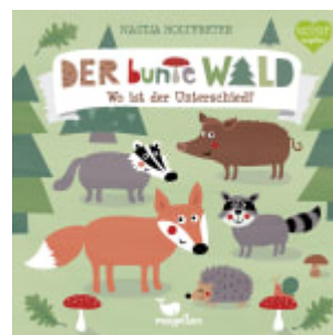
Der bunte Wald - Wo ist der Unterschied?