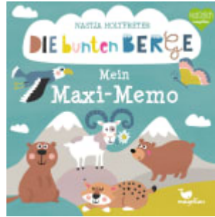
Die bunten Berge - Mein Maxi-Memo