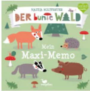
Der bunte Wald - Mein Maxi-Memo