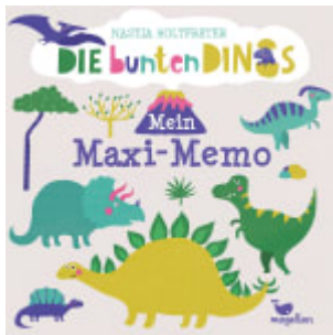
Die bunten Dinos - Mein Maxi-Memo