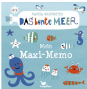
Das bunte Meer - Mein Maxi- Memo