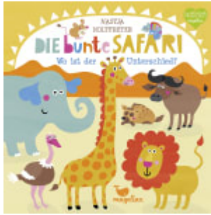
Die bunte Safari - Wo ist der Unterschied?