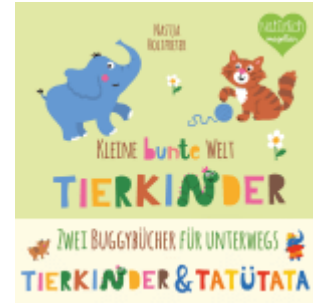
Kleine bunte Welt - Tierkinder & Tatütata