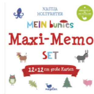
Mein buntes Maxi-Memo-Set