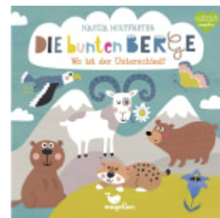
Die bunten Berge - Wo ist der Unterschied?