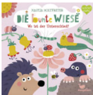
Die bunte Wiese - Wo ist der Unterschied?