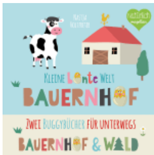
Kleine bunte Welt - Bauernhof & Wald