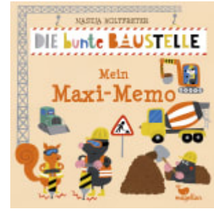
Die bunte Baustelle - Mein Maxi-Memo