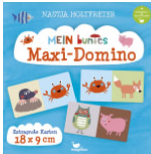
Mein buntes Maxi-Domino