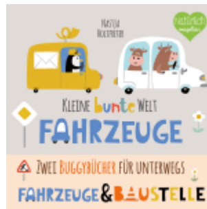
Kleine bunte Welt - Fahrzeuge & Baustelle