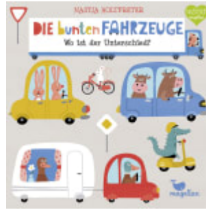
Die bunten Fahrzeuge - Wo ist der Unterschied?