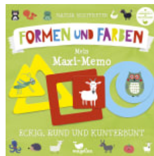
Eckig, rund und kunterbunt - Mein Maxi-Memo - Formen und Farben