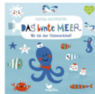
Das bunte Meer - Wo ist der Unterschied?