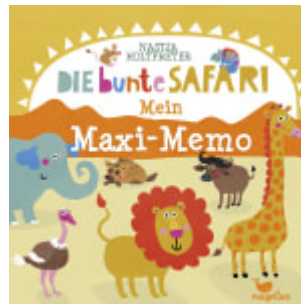
Die bunte Safari - Mein Maxi-Memo