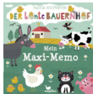
Der bunte Bauernhof - Mein Maxi-Memo