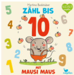
Zähl bis 10 mit Mausi Maus