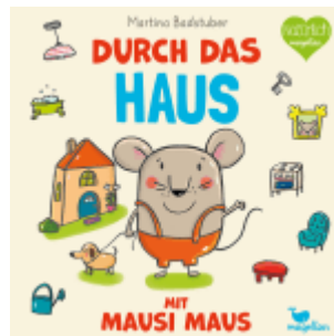
Durch das Haus mit Mausi Maus