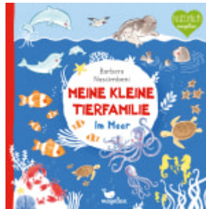
Meine kleine Tierfamilie - Im Meer