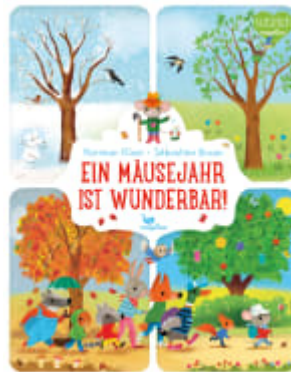
Ein Mäusejahr ist wunderbar!