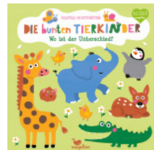
Die bunten Tierkinder - Wo ist der Unterschied?