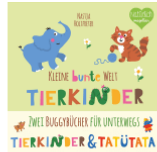
Kleine bunte Welt - Tierkinder & Tatütata