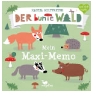
Der bunte Wald - Mein Maxi-Memo