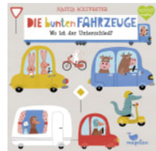
Die bunten Fahrzeuge - Wo ist der Unterschied?