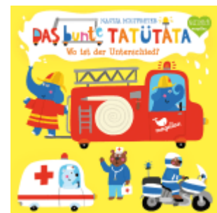
Das bunte Tatütata - Wo ist der Unterschied?