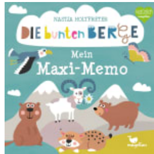
Die bunten Berge - Mein Maxi-Memo