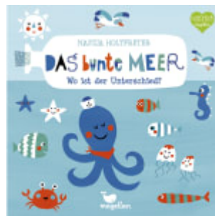
Das bunte Meer - Wo ist der Unterschied?