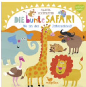
Die bunte Safari - Wo ist der Unterschied?