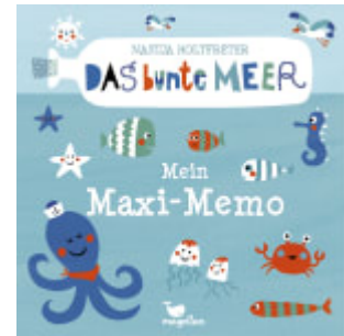
Das bunte Meer - Mein Maxi-Memo