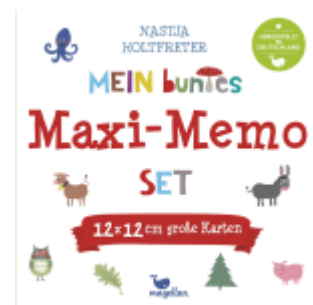
Mein buntes Maxi-Memo-Set