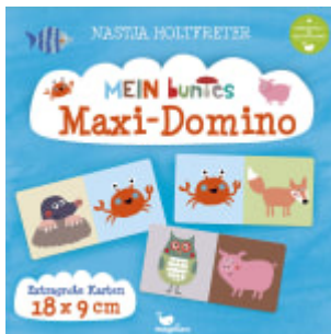
Mein buntes Maxi-Domino