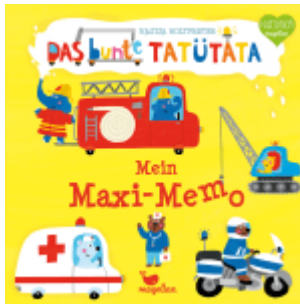
Das bunte Tatütata - Mein Maxi-Memo