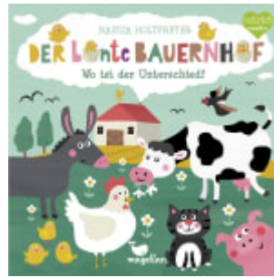
Der bunte Bauernhof - Wo ist der Unterschied?