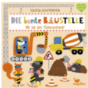
Die bunte Baustelle - Wo ist der Unterschied?