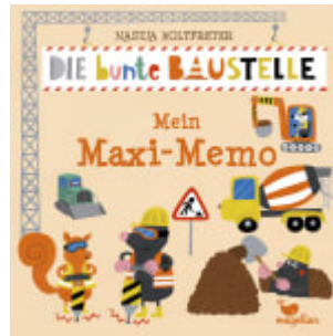
Die bunte Baustelle - Mein Maxi-Memo