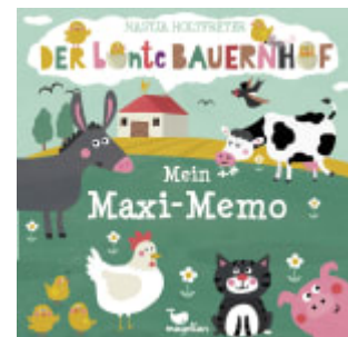
Der bunte Bauernhof - Mein Maxi-Memo