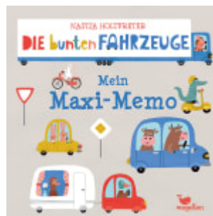
Die bunten Fahrzeuge - Mein Maxi-Memo