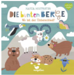
Die bunten Berge - Wo ist der Unterschied?