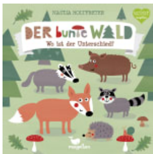
Der bunte Wald - Wo ist der Unterschied?