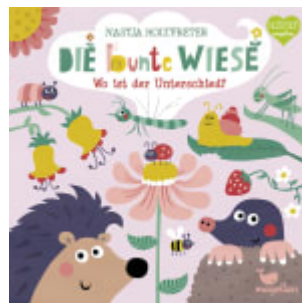
Die bunte Wiese - Wo ist der Unterschied?