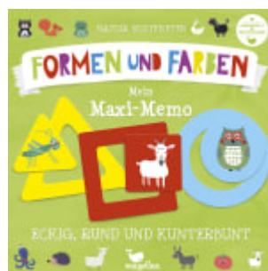
Eckig, rund und kunterbunt - Mein Maxi-Memo - Formen und Farben