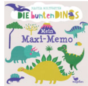
Die bunten Dinos - Mein Maxi-Memo