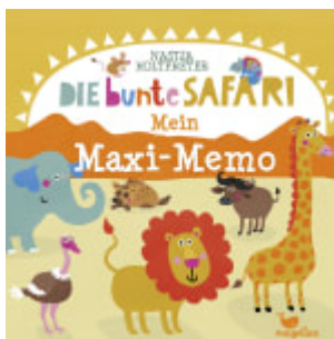
Die bunte Safari - Mein Maxi-Memo