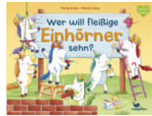
Wer will fleißige Einhörner sehen?