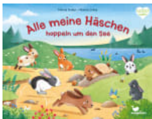
Alle meine Häschen hoppeln um den See