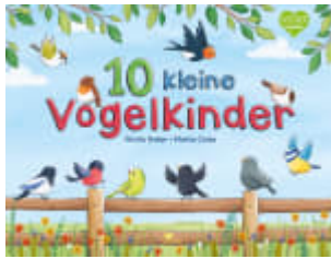
10 kleine Vogelkinder