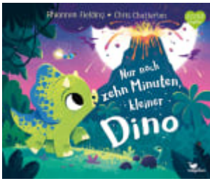
Nur noch zehn Minuten, kleiner Dino