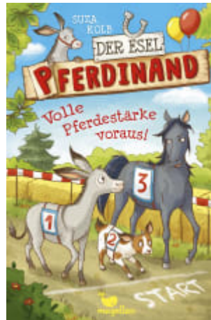
Der Esel Pferdinand - Volle Pferdestärke voraus! (Band 3)