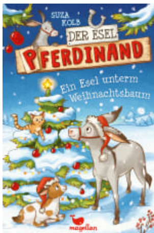
Der Esel Pferdinand - Ein Esel unterm Weihnachtsbaum (Band 5)