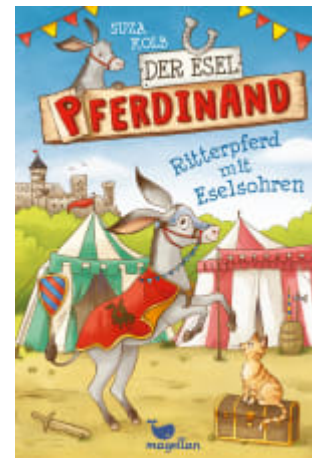
Der Esel Pferdinand - Ritterpferd mit Eselsohren (Band 4)