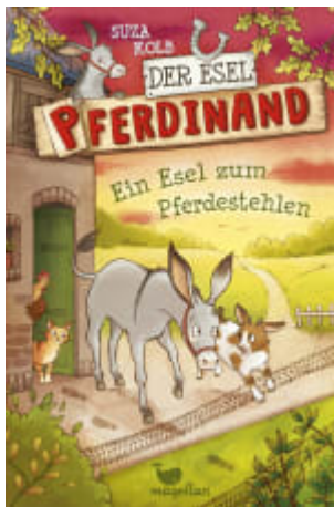
Der Esel Pferdinand - Ein Esel zum Pferdestehlen (Band 2)