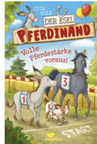
Der Esel Ferdinand - Volle Pferdestärke voraus! (Band 3)