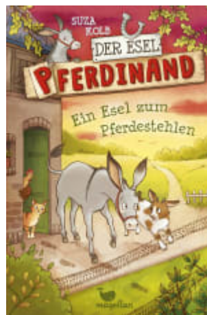
Der Esel Ferdinand - Ein Esel zum Pferdstehlen (Band 2)