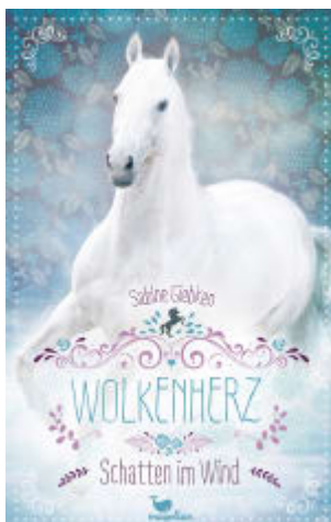
Wolkenherz - Schatten im Wind (Band 3)