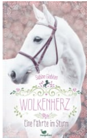
Wolkenherz - Eine Fährte im Sturm (Band 2)