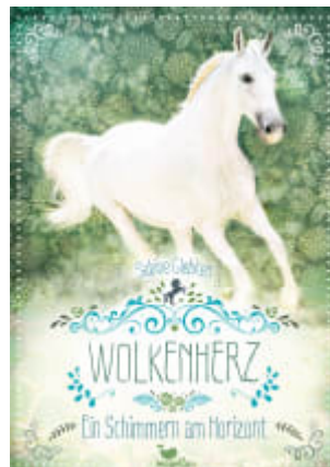
Wolkenherz - Ein Schimmern am Horizont (Band 4)