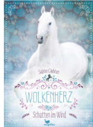
Wolkenherz - Schatten im Wind (Band 3)