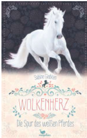
Wolkenherz - Die Spur des weißen Pferdes (Band 1)