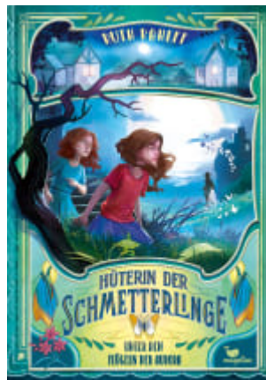
Hüterin der Schmetterlinge - Unter den Flügeln der Aurora (Band 2)