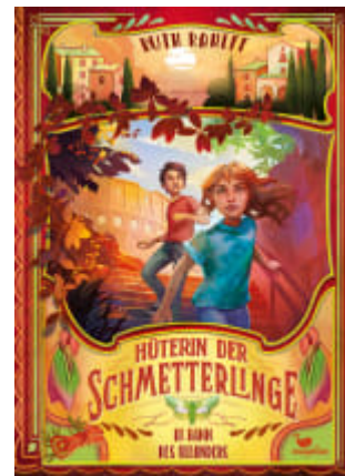
Hüterin der Schmetterlinge - Im Bann des Oleanders (Band 3)