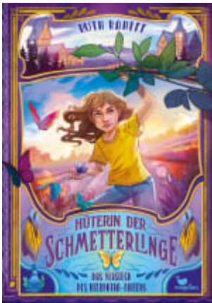
Hüterin der Schmetterlinge - Das Versteck des Kleopatra- Falters (Band 1)