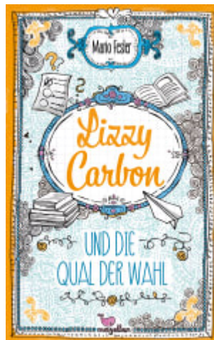
Lizzy Carbon und die Qual der Wahl (Band 3)