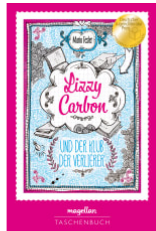
Lizzy Carbon und der Klub der Verlierer (Band 10000)