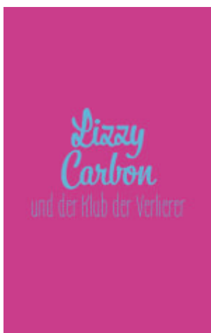
Lizzy Carbon und der Klub der Verlierer (Band 10000)