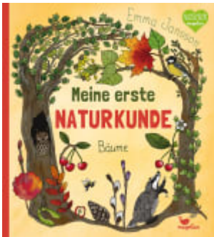
Meine erste Naturkunde - Bäume