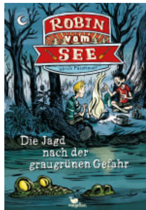
Robin vom See - Die Jagd nach der graugrünen Gefahr (Band 2)