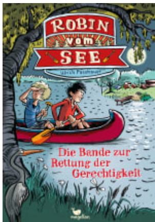
Robin vom See - Die Bande zur Rettung der Gerechtigkeit (Band 1)